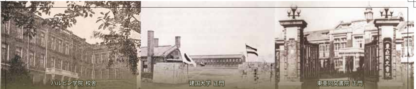
ハルピン学院 校舎